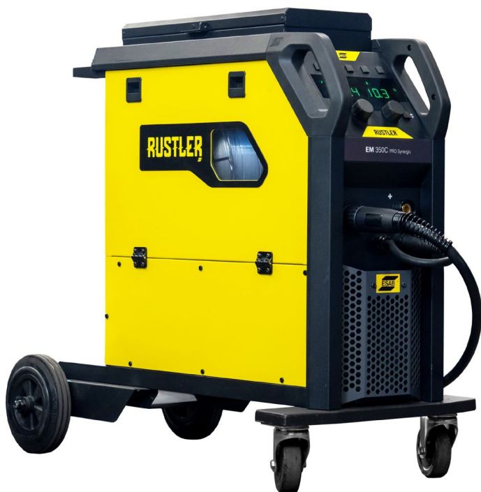
Rustler EM 350C PRO Synergic

Den kompakta svetsinvertern Rustler MIG PRO är ditt rätta val för de vanligaste svetsutmaningarna. Tack vare den senaste invertertekniken kombineras låg energiförbrukning med optimerad svetsprestanda.