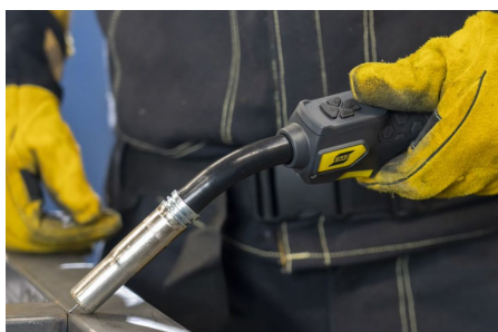
Exeor MIG-svetspistol med fjärrkontroll