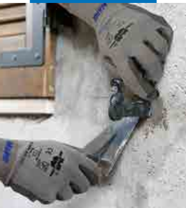
Fixering av gångjärn till fönsterluckor med Lampocem