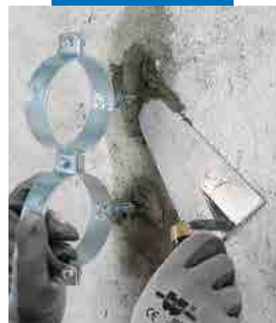
Fixering av konsoler för rör med Lampocem