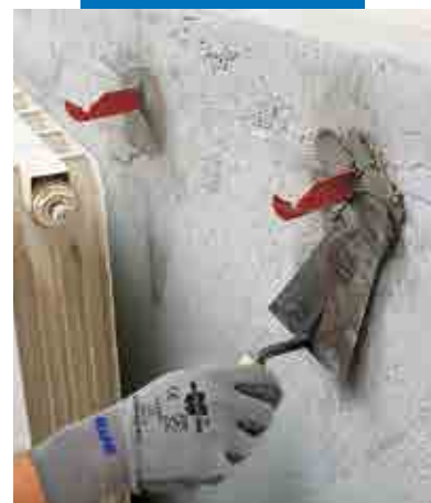
Fixering av bultar till radiatorkonsoler med Lampocem